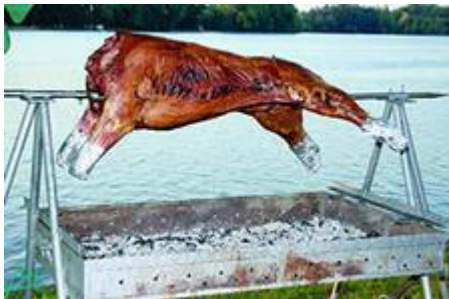
Баран запечённый целиком

(Торжественный вынос с огненными фонтанами)