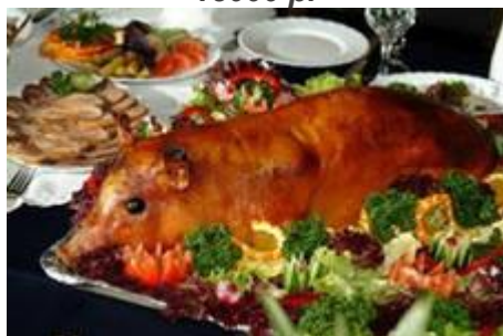
Поросёнок фаршированный гречей с белыми грибами