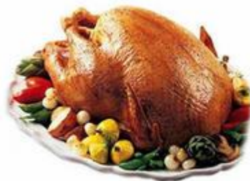
Индейка фаршированная телячьей печенью с белыми грибами